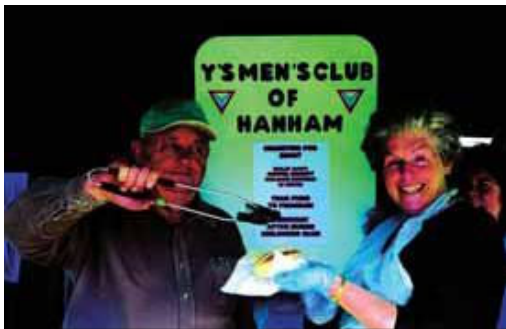
Um trabalho legal para o Hanham Common Fair